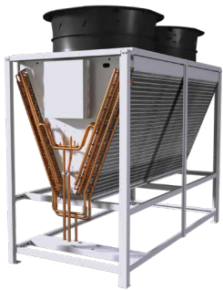
集中式风冷室外机