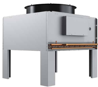
平板式风冷室外机