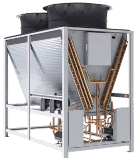
集中式氟泵室外机